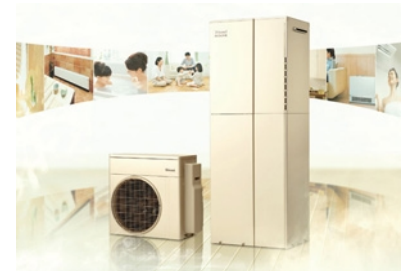
ハイブリッド給湯・暖房システム /ECO ONE