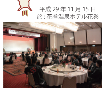
↑多くの関係業者様においで頂きました 当日はありがとうございました