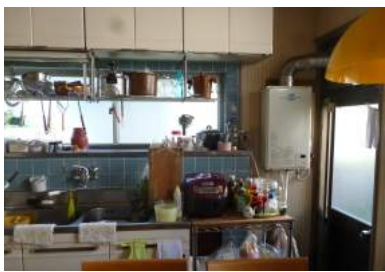
↑台所(リフォーム前)独立した一部屋でした

新築カリフォームが悩まれましたが、お母様のされていた茶道を、奥様も引き継いでなさるとのこと、二間続きの和室を生かしたリフォームをすることにしました。