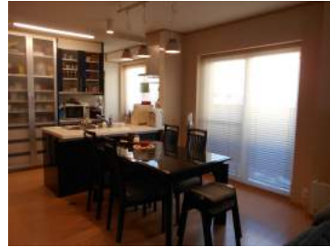
↑リビングに続くダイニングキッチンに

築80年のため、基礎を補強。梁の補強をして台所、居間、応接室をワンフロアにしたり、縁側をなくしたりと、以前の間取りが想像できない家になりました。 今回はパネルヒーター暖房をお奨めし、断熱は内断熱で、隙間を作らないよう気を付けました。 外部玄関まわりや玄関上り框には、けやきの無垢材を使い、以前の障子も生かし、モダンな和風の空間となりました。「家全体が暖かく、お母さんも、移動も苦にならず暮らしています」との一言に、ホッとしています。(佐藤さ)