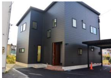
↑片流れ屋根と黒の外観でシャープな印象